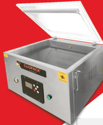
VAC-510 | 510ST